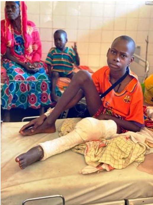
Bild 8. 4-Postop-Tag